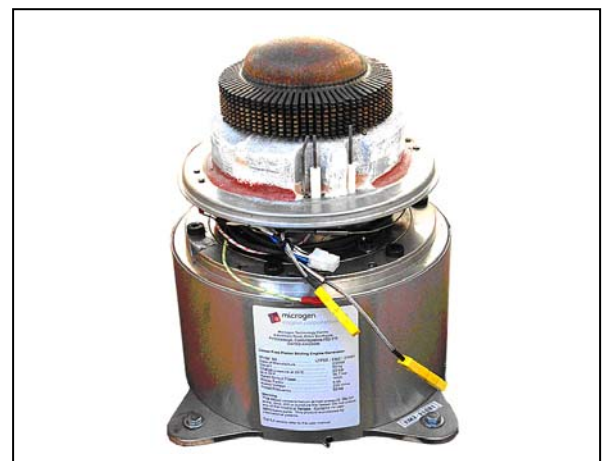
fig. 2 1kwフリーピストンスターリングエンジン

今回の実証実験に用いた 1kwフリーピストンスターリングエンジンを fig. 2 に示す。